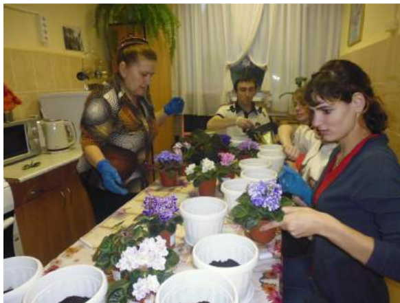
На занятии «Растениеводство»