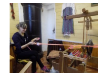
Мастерская народных промыслов в Доме ремесел г. Порхова