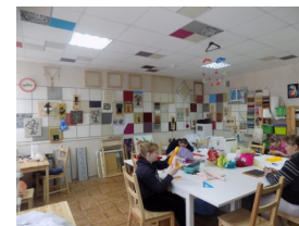
Мастерская декоративно-прикладного творчества

Каждый воспитанник имеет возможность заниматься любимым делом в интернате и вне учреждения.