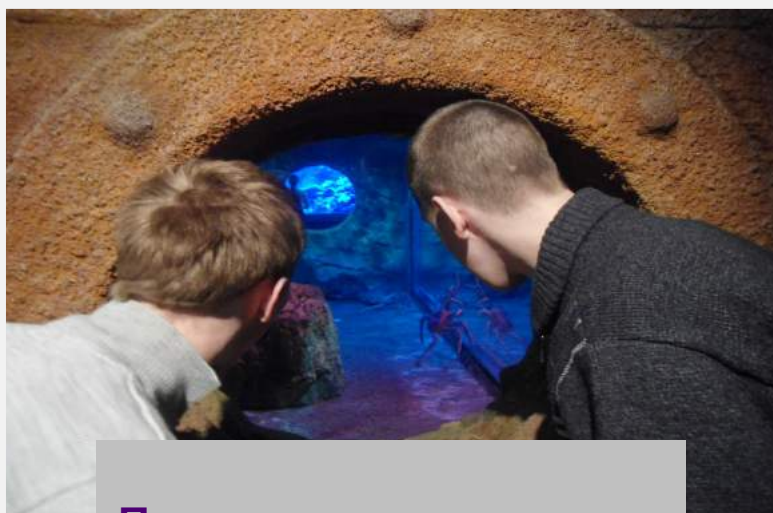
Пауки и змеи ...